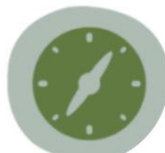
ODDÍL NOVÉ HRADY