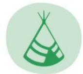
ODDÍL HOŘICE NA ŠUMAVĚ