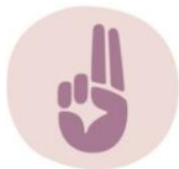
ODDÍLY ČESKÝ KRUMLOV