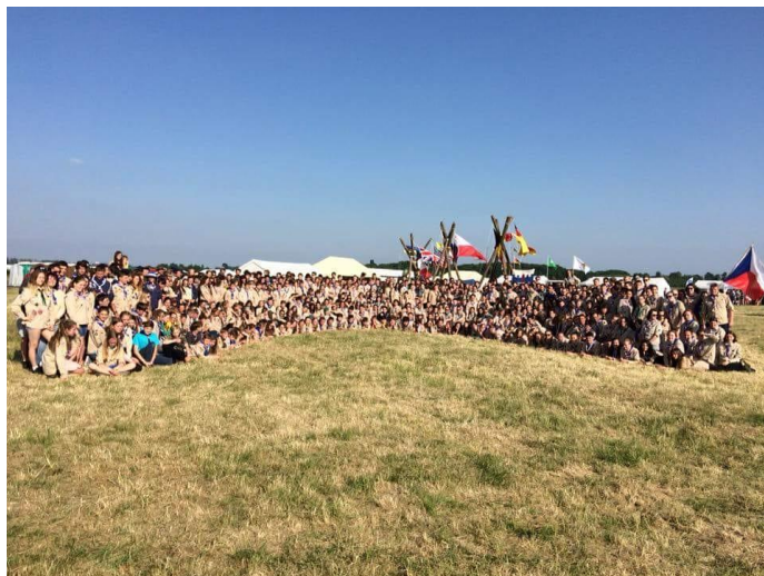
Foto: Jamboree USA 2019, Obrok 2017, Intercamp 2018 Belgie